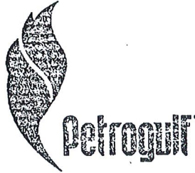
رئيس مجلس الإدارة

Gulf Petroleum Investment S.A.K Established in 1998-Commercial Register No. (72854) Kuwait - Sharq - Jaber Al-Mubarak Street - Behbehani Complex - Floor 16 P.O.Box 22505 Al Safat, 13086 Kuwait Tel.: +965 22252211 - Fax: +965 22252136 Paid up Capital Amount : 45.578.153.000 - C.R.Code: 72854